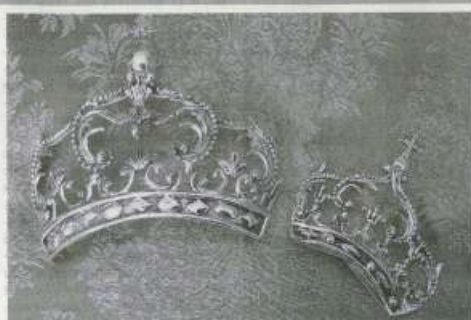
Le due corone

●●● In occasione del 50° anniversario di fondazione della parrocchia Maria Ss. della Salute di Castelvetrano, oggi alle 19 presso la parrocchia, si terrà il rito di incoronazione con le due corone che il Comune ha donato alla parrocchia e che sono state restaurate. Il rito sarà presieduto dal Vescovo monsignor Domenico Mogavero. Il rito è proprio di competenza strettamente riservata al Vescovo diocesano. Le due corone erano custodite presso il Museo civico e ora sono state donate alla parrocchia. (*SG*)